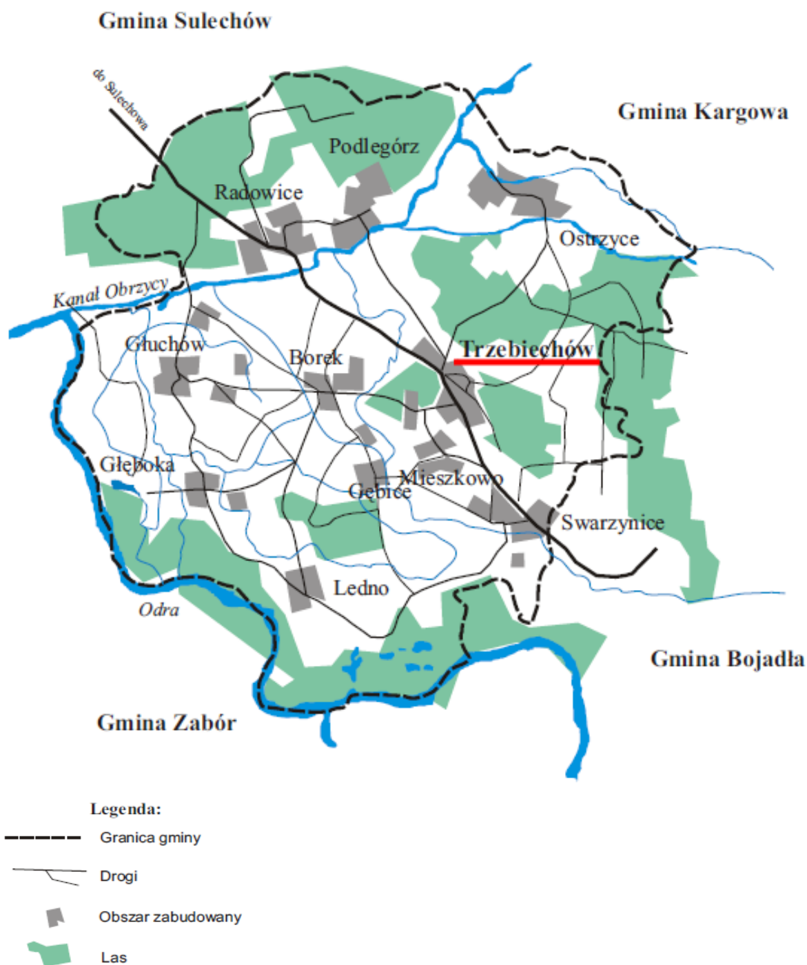
Rys. 2. Gmina Trzebiechów