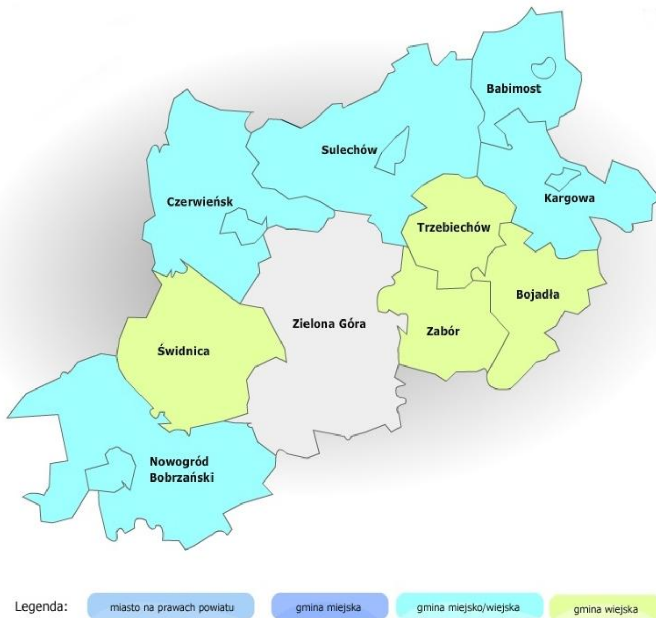
Rys. 1. Gmina Trzebiechów na tle Powiatu Zielonogórskiego